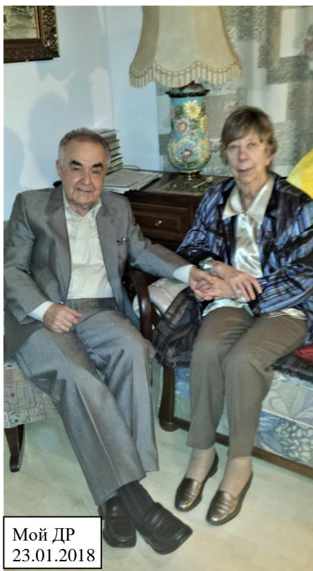
Мой ДР 23.01.2018

На наши писанные жалобы доктор, по возможности, реагировал, видно, пытался подобрать что-то индивидуально опти-